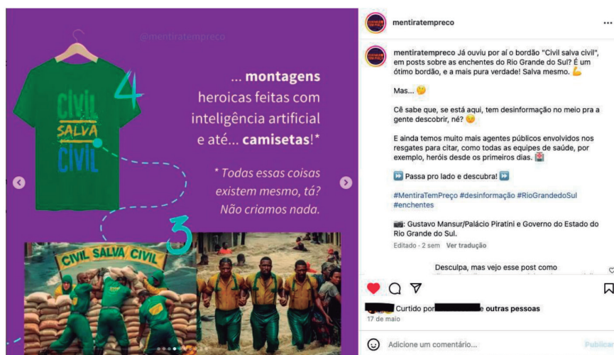
Figura 1 - print de postagem do @mentiratempreco sobre #civilsalvacivil