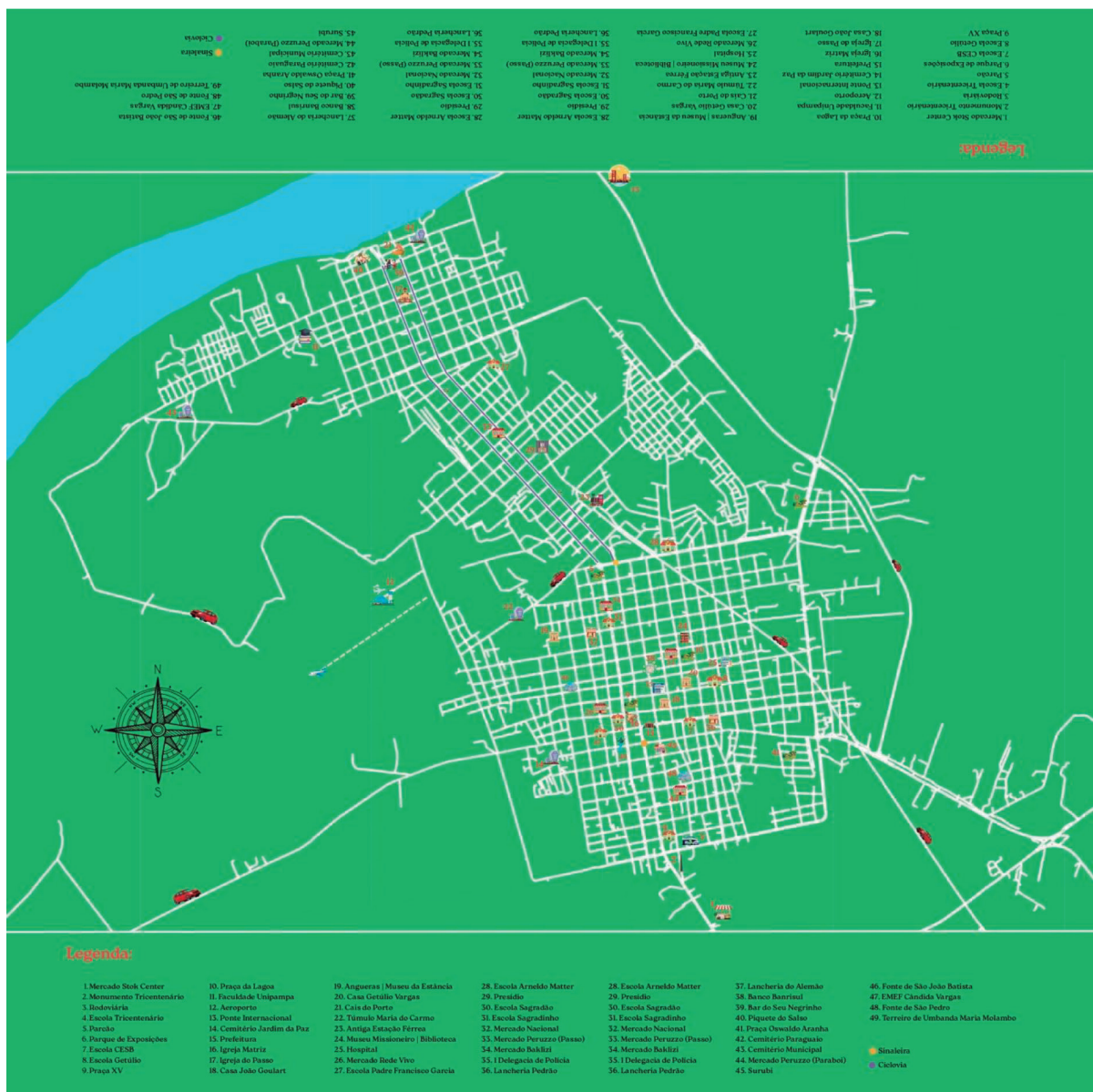
Figura I: Mapa do História em Jogo , representando os principais espaços históricos e culturais de São Borja.