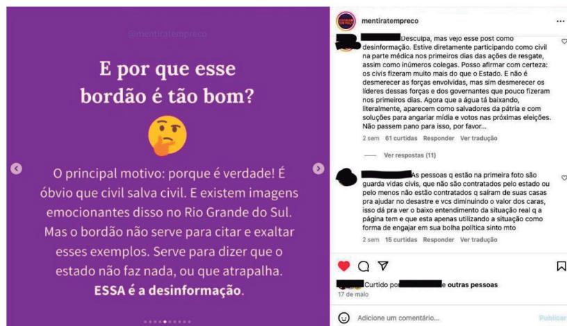
Figura 2 - print de postagem do @mentiratempreco sobre desinformação