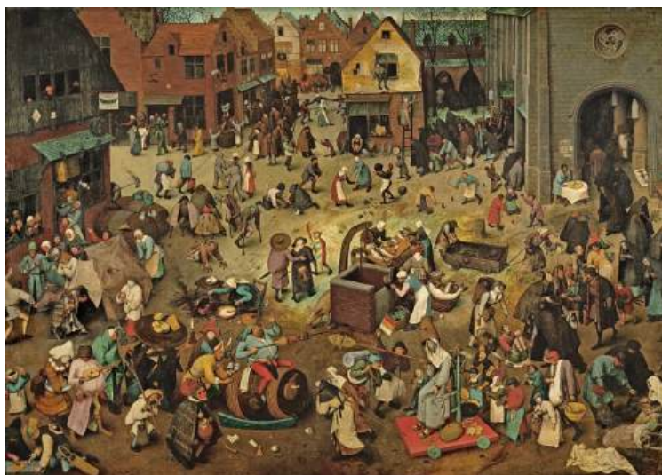
Figura 1 - Luta entre o Carnaval e a Quaresma. Pieter Bruegel, 1559, Óleo sobre Tela, Museum de vienna. 5

dos valores pagãos da vida, em contraste com o período de exaltação do sofrimento e do luto, valores cristãos da quaresma.” (1998, p.02). Para ilustrar visualmente esse contraste entre a celebração carnavalesca e a disciplina da Quaresma, a obra ‘Luta entre o Carnaval e a Quaresma’, de Pieter Bruegel (1559), ajuda a contextualizar como essa oposição já era representada na cultura europeia.