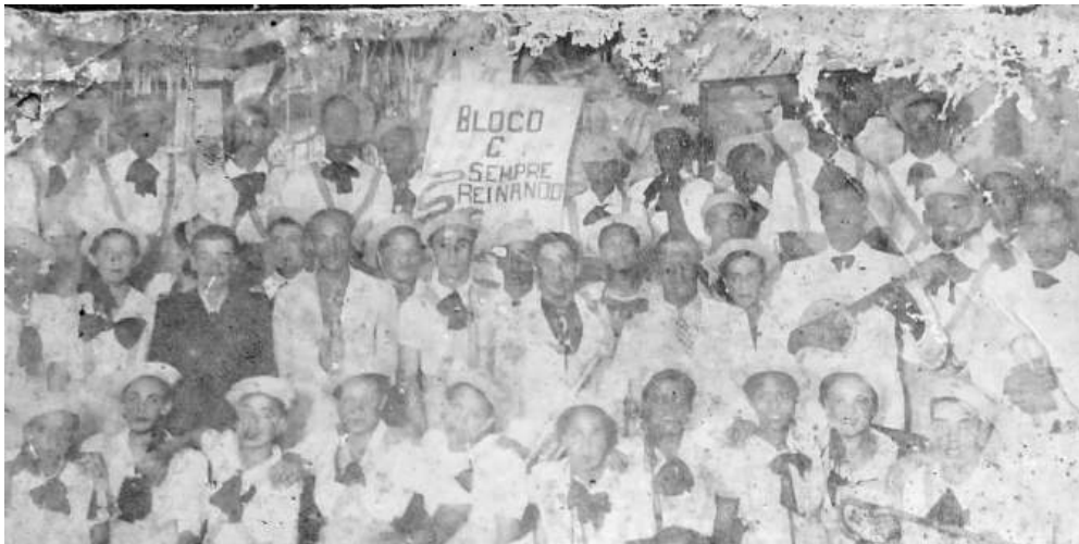
Figura 3 - Bloco Sempre Reinando. 13

Segundo Garcez (2025), enquanto nos clubes das elites se realizavam os bailes de gala, o povo negro arroio-grandense, sem ter um lugar fixo para manifestar sua cultura, passou a ir as ruas, onde acabaram criando blocos e cordões de carnaval. Numa festividade de 1913, encontra-se o primeiro registro de um bloco burlesco, denominado de “Bloco dos Africanos”. Há ainda a criação do “Troveja Mas Não Chove” e o “Sempre Reinando”, blocos fundados por cidadãos negros e que compuseram o nascimento do carnaval de rua no município (Garcez, 2025). 12