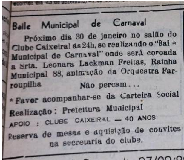
Figura 10 - Convite para o Baile Municipal de Carnaval, publicado no jornal A Evolução, 29 de Janeiro de 1968. (2025)

Importante ressaltar a criação de blocos carnavalescos que eram compostos apenas por mulheres, um exemplo seria o bloco “A Luluzinha”, surgido no ano de 1981 e que se reúne em um grupo fechado de amigas e convidadas para realizar desfiles nas ruas da cidade.