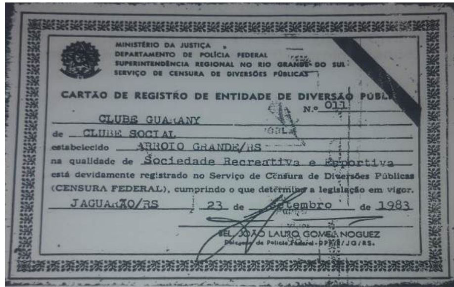
Figura 4 - Registro de identidade da Associação Recreativa Clube Guarani. Fonte: Reconstruindo a história do clube Guarani (1999, p. 7)

A entrada de pessoas negras nos espaços sociais das elites só poderia ser para prestações de serviços, um exemplo seria o da tradicional Jazz Band Farroupilha, formada em 1933 e composta por homens negros. Essa banda era comumente convidada para animar festas durante o período carnavalesco, principalmente nos clubes sociais, onde grandes bailes de carnaval eram realizados. A banda utilizava instrumentos de sopro, percussão, além do afoxé (instrumento de origem iorubá, muito utilizado em rituais religiosos) e o banjo (instrumento de origem africana, que passou a ser incorporado no jazz). Corrêa (2023) afirma que a utilização desses instrumentos demonstrava que mesmo o grupo realizando apresentações para um público majoritariamente branco, e vivenciando uma grande repressão de seus costumes, eles carregavam elementos da cultura afro-brasileira como forma de resistência. 14