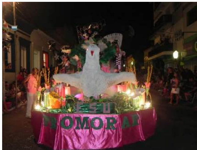
Figura 16 - Carro abre-alas da Unidos do Promorar, Arroio Grande 2019.

escola do respectivo local. Possui 6 títulos de campeã do carnaval arroio-grandense, obtidos entre os anos de 1994-1996-2000-2006-2008 e 2011.