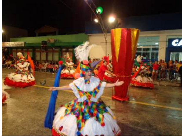
Figura 14 - Desfile da Samba no pé, Arroio Grande 2014. Obs: neste ano a escola teve como tema enredo o Sopapo, instrumento Afro-gaúcho.