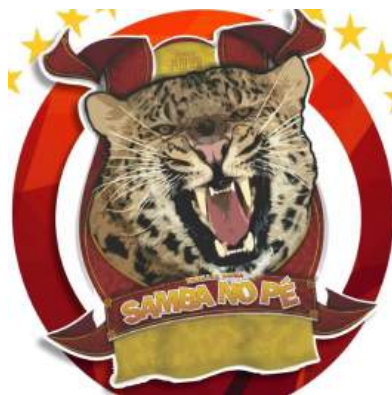
Figura 13 - Logo da Escola de Samba “Samba no pé”.

Sem outro objetivo, a não ser aproveitar o carnaval após os bailes do Clube, levaram o pequeno bloco mirim para o baile infantil do Canecão. 21 Segundo relatos, ao retornarem, na rua encontraram uma simpatizante que, encantada com o samba das crianças, afirmou: “Mas olha como sambam! Vou colocar um nome em vocês, vai ser Samba no Pé”. A partir desse ponto foi fundado o Bloco Mirim Samba no pé, que desfilava na passarela do samba com um grupo regional que realizava a percussão dos instrumentos: “Em 1990, foram convidados a criarem mais uma escola de samba para somar no carnaval juntamente com Promorar e São Gabriel, resolveram então organizar uma escola adulta que manteria o nome de Samba no pé” (, 2020, p. 17)