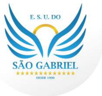
Figura 11 - Logo da Escola de Samba Unidos do São Gabriel.

A escola possui como símbolo o Anjo Gabriel, e em suas cores oficiais estão o Verde, Amarelo, Azul e Branco. Popularmente conhecida como a “Rainha do Samba”, realiza seus ensaios em meio ao bairro onde a mesma foi fundada. Atualmente, a Escola é detentora de 13 títulos do carnaval arroio-grandense, sendo esses conquistados nos anos de 1990-1992-1993-1998-1999-2001-2002-2006-2007-2011-2013-2020 e 2025. (Portal Brasil Carnaval, 2025) 19