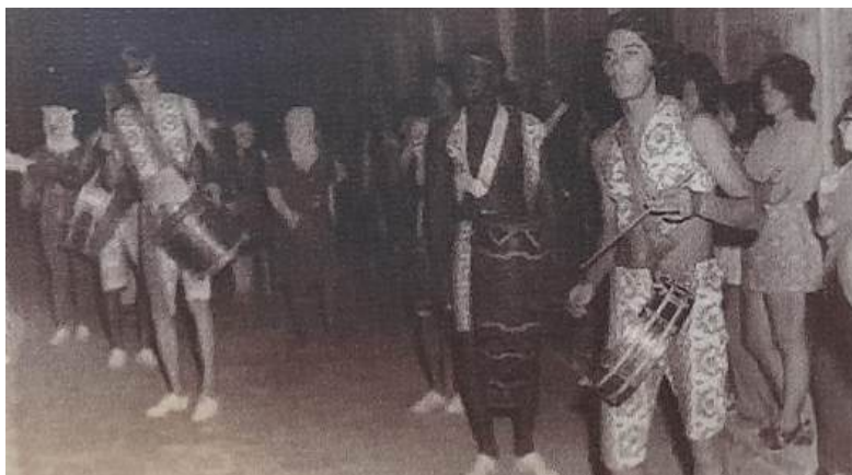
Figura 7 - Desfile da Escola de Samba “Pé de Arroz”, carnaval de 1972.

Nesse período também temos o aparecimento da “Academia do Ritmo”, composta apenas por homens, e que saía às ruas da cidade com sua bateria e alguns passistas, ou então a Escola de Samba Pé de Arroz, que realizava desfiles de fantasias na rua central do município, possuíam uma bateria própria, além de carros alegóricos (infelizmente encontrei apenas duas imagens da escola).