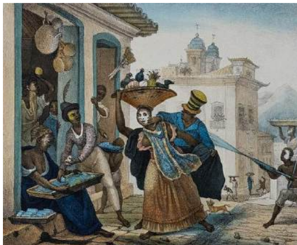
Figura 2 - Cena de Carnaval, Debret, aquarela sobre papel, 18 x 23 cm, 1823. 7

A imagem representa um grupo de pessoas envolvidas em brincadeiras carnavalescas, como o arremesso das águas de cheiro. É notável evidenciar o carnaval como uma prática social profundamente ligada às camadas populares e à cultura afro-brasileira, destacando seu caráter coletivo e urbano, anterior à institucionalização das escolas de samba.