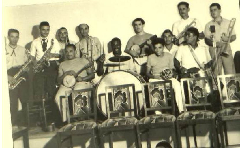
Figura 5: Banda Farroupilha.

Muitos blocos burlescos acabaram sendo criados no município, através das fontes pesquisadas encontrei relatos de alguns, mas certamente existiam mais. Esses grupos carnavalescos se formavam com o intuito de desfilar na principal avenida do município. Alguns foram inaugurados dentro dos clubes sociais, como por exemplo o Bloco “Sempre Reinando”, constituído por integrantes do Clube Guarani e que festejava a chegada do carnaval junto aos seus foliões. Um dos relatos encontrados sobre esse Bloco, remonta ao ano de 1936, onde o mesmo através de um desfile, levou os cumprimentos à corte de outro clube social da cidade.:“No ano de 1936, como em todos os carnavais, o bloco sempre reinando levou os cumprimentos ao Sr. Prefeito e à Rainha de 1938 do Clube Instrução e Recreio, Srt a Maria Constança S. Costa.” (Reconstruindo a história do clube Guarani, 1999, p. 15)