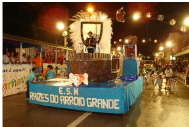
Figura 19 - Carro abre-alas da escola Raízes do Arroio Grande, Arroio Grande, 2008.

Seguindo na categoria mirim, temos a Escola de Samba Mirim Raízes do Arroio Grande, fundada no dia 02 de Junho de 2004, possuindo como símbolo da escola um coração alado, e suas cores oficiais o Azul e o Branco. Sendo uma agremiação criada no bairro Promorar, a mesma abrangia as crianças do mesmo, formando percussionistas e simpatizantes do carnaval. A escola acabou realizando seu último desfile no ano de 2011. (Blog Respirando Carnaval, 2014)