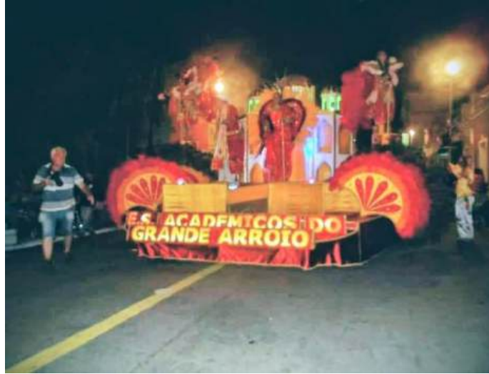
Figura 18 - Carro abre-alas da Acadêmicos do Grande Arroio, Arroio Grande, 2015.

Seguindo na categoria mirim, temos a Escola de Samba Mirim Raízes do Arroio Grande, fundada no dia 02 de Junho de 2004, possuindo como símbolo da escola um coração alado, e suas cores oficiais o Azul e o Branco. Sendo uma agremiação criada no bairro Promorar, a mesma abrangia as crianças do mesmo, formando percussionistas e simpatizantes do carnaval. A escola acabou realizando seu último desfile no ano de 2011. (Blog Respirando Carnaval, 2014)