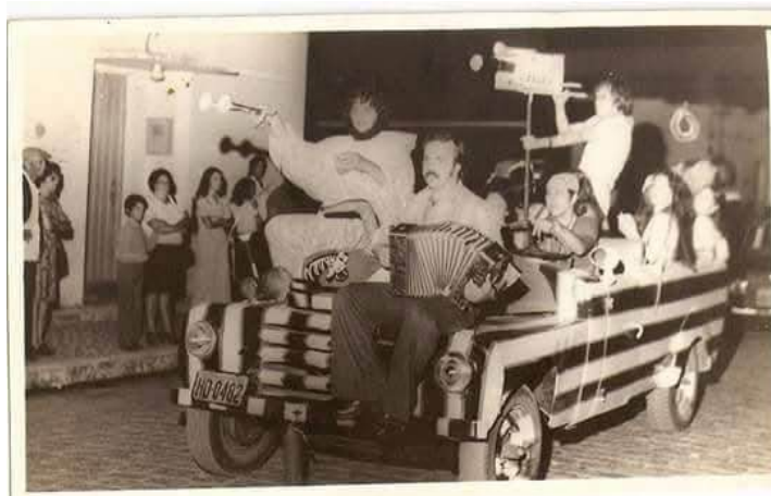
Figura 6 - A “Camicicleta”, Carnaval da década de 1970. Fotografia publicada no grupo Defensores do Patrimônio Histórico e Cultural de Arroio Grande (Facebook). Acesso em: 25 Nov. 2025.

diversos personagens, acompanhados de grandes bonecos, que se tornaram um símbolo do bloco, entusiasmando assim os foliões do município. 15