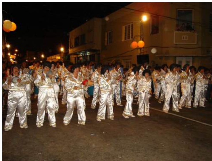
Figura 12 - Desfile da bateria da São Gabriel, Arroio Grande, 2011. 20 Obs: Me encontro entre os participantes da bateria da escola deste ano.

A escola possui como símbolo o Anjo Gabriel, e em suas cores oficiais estão o Verde, Amarelo, Azul e Branco. Popularmente conhecida como a “Rainha do Samba”, realiza seus ensaios em meio ao bairro onde a mesma foi fundada. Atualmente, a Escola é detentora de 13 títulos do carnaval arroio-grandense, sendo esses conquistados nos anos de 1990-1992-1993-1998-1999-2001-2002-2006-2007-2011-2013-2020 e 2025. (Portal Brasil Carnaval, 2025) 19