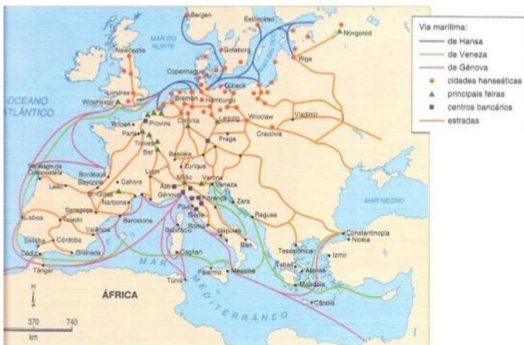
Figura 1 Rotas de Comércio Mediterrâneo no século XII 6

No mapa acima temos as rotas comerciais do Mar Mediterrâneo, no século XII, onde podem ser identificadas as estradas que passavam pelo território do Languedoc e seguiam para diferentes regiões como Espanha, Itália, Grécia, Inglaterra, Alemanha, Áustria, Escandinávia, até Cracóvia/Polônia e Kiev/Ucrânia. Neste sentido, é possível pensar que o crescimento econômico e dinamismo comercial viabilizaram o contato e interação de culturas, auxiliando para que o movimento cátaro se espalhasse com velocidade. A força religiosa do catarismo, em parte, tinha origem em seu respaldo econômico-comercial, vinculado a seus simpatizantes e uma rede de contatos bem estabelecida entre comerciantes e nobres de diferentes regiões da Europa.