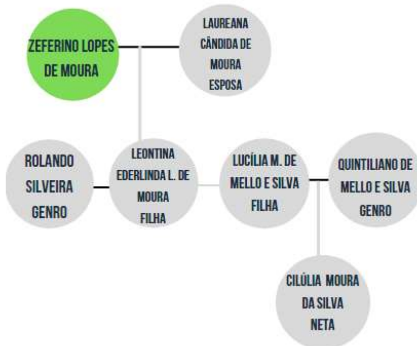
Figura 2. Árvore genealógica da família de Zeferino Lopes de Moura.

Através do inventário e de um anúncio de casamento no jornal A Federação, é possível montar uma pequena árvore genealógica da família de Zeferino.