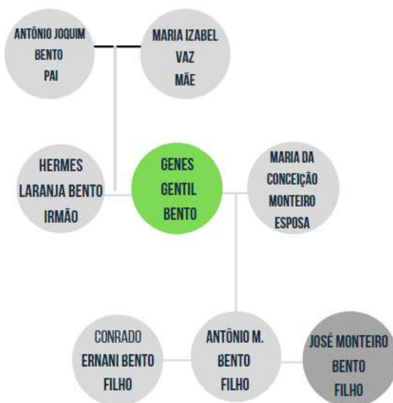
Figura 4 - Árvore genealógica da família de Genes Gentil Bento.

Não constando inventário ou testamento próprio de Genes Gentil Bento, nem de seu pai, não é possível realizar uma análise do capital econômico da família. Foi possível, contudo, construir uma pequena genealogia, através de notícias de periódicos disponíveis na Hemeroteca digital da Biblioteca Nacional.