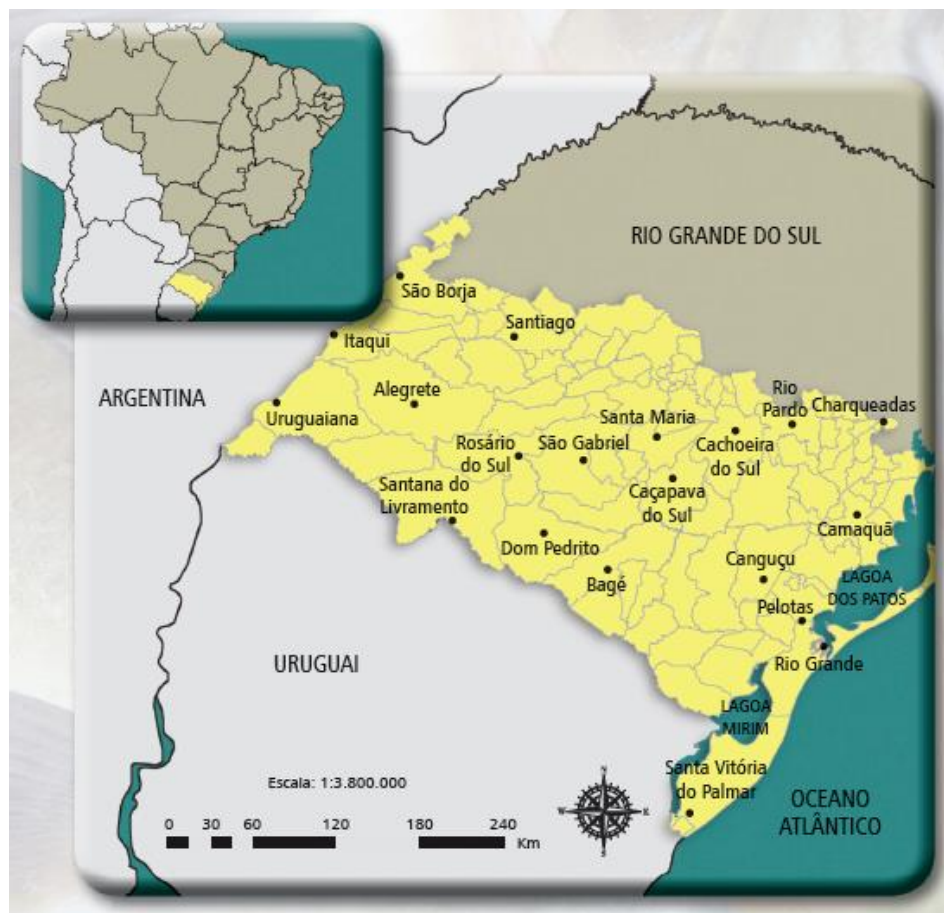
Figura 1 - Mesorregião da Metade Sul do Rio Grande do Sul

A Mesorregião da Metade Sul do Rio Grande do Sul, conforme o Ministério da Integração, “possui um território de 154.100 km 2 que abrange 105 municípios do extremo sul do país, abriga uma população de aproximadamente 2.638.350 habitantes e faz fronteira com Argentina e Uruguai, além de atingir uma parte do litoral gaúcho. Possui um vasto e exclusivo patrimônio natural, que é o bioma “Pampa”, com clima, solo, recursos genéticos e águas subterrâneas e de superfície, todos muito peculiares em relação ao Brasil; e um particular patrimônio cultural, cujo principal elemento é a figura do “Gaúcho” nos aspectos de capital social e relacional, além da potencialidade como riqueza turística.” (MINISTÉRIO DA INTEGRAÇÃO, 2009). Tomando-se o espaço de inserção da UNIPAMPA nessa Mesorregião, vista na Figura 1, que abarca três Conselhos Regionais de Desenvolvimento - s (regiões geopolíticas do estado do RS): a Região Fronteira Oeste, a Região da Campanha e a Região Sul.