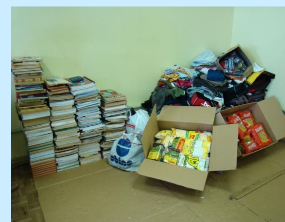
Resultados da Gincana....