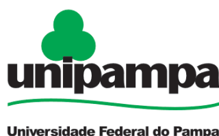
Figura 2 – Exemplo de figura importada de um arquivo e também exemplo de caption muito grande que ocupa mais de uma linha na Lista de Figuras

O \text{\LaTeX} permite utilizar vários formatos de figuras, entre eles eps , pdf , jpeg e png . Programas de diagramação como Inkscape (e mesmo LibreOffice) permitem gerar